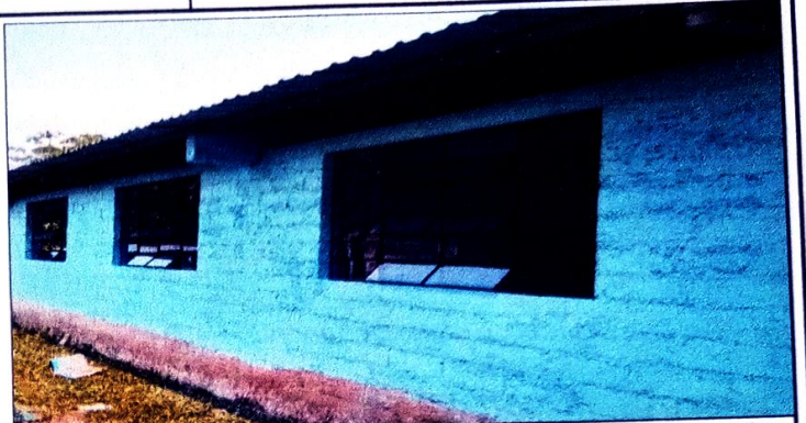
Foto 2: MANTENIMIENTO DE BASE PARA VIDRIOS Y SUSTITUCION DE VIDRIOS